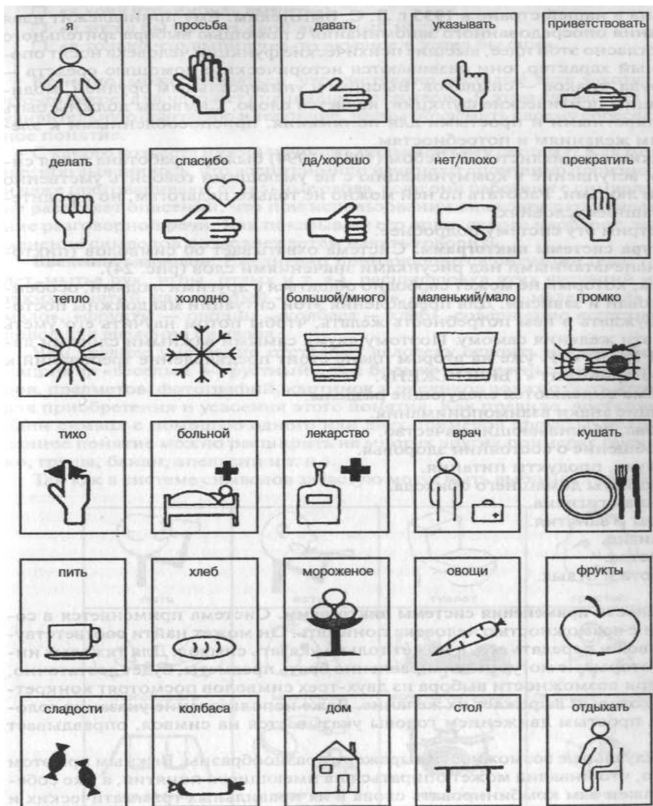
пиктограмм Р. Леба